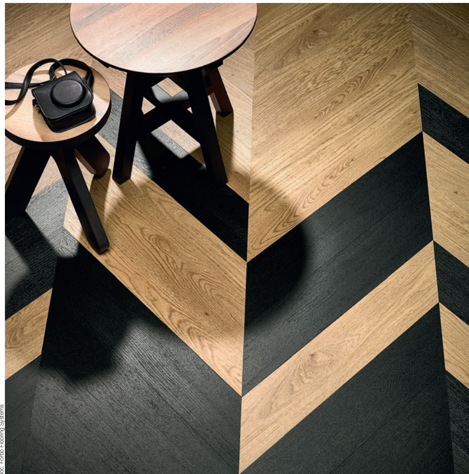
doc. Forbo Flooring Systems

Allura se démarque par l'amplitude de son offre, par la multitude de formats disponibles et par ses designs novateurs et différenciants. Création d'espaces de zoning, conception de plusieurs ambiances au sein d'un même lieu ou utilisation du sol comme signalétique : tout est possible !